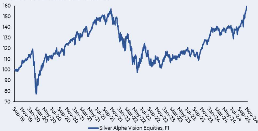
Return as of November 30th, 2024

The performance data quoted represents past performance and does not guarantee future results.